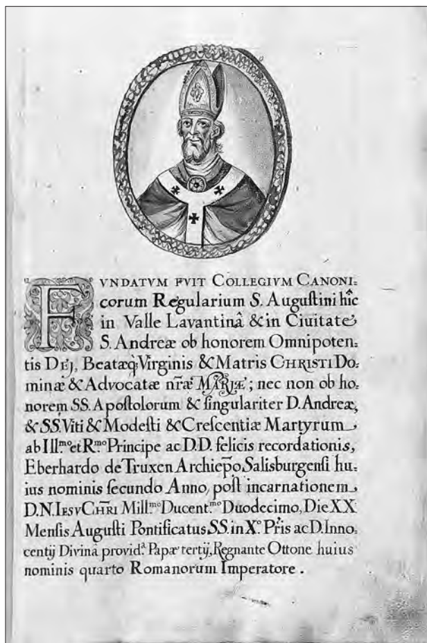
Miniatura salzburskega nadškofa Eberharda II., ustanovitelja škofije (KAM, Kodeks Mayr)

okoli sv. Florijana ob Laznici (Groß St. Florian) na zahodnem Štajerskem. V ustanovni listini je nadškof novonastali škofiji dodelil naslednje župnije oziroma cerkve: župnijo/cerkev sv. Andraža v Labotski dolini s podružnicami, župnijo/cerkev Lavamünd s podružnicami, župnijo/cerkev Remšnik, župnijo/cerkev sv. Florijana ob Laznici (Groß St. Florian) s podružnicami, podružnico/kapelo sv. Petra ob Lindenbergu (St. Peter im Sulmtal), podružnico/kapelo sv. Martina (St. Martin im Sulmtal) in podružnico/kapelo [sv. Andreja] v Slatinskem dolu jugozahodno od Lipnice (St. Andrä im Sausal). Škofija je tako prvotno obsegala ozemlje, ki je spadalo pod vojvodini oziroma kasnejši deželi Štajerska in Koroška, danes se to ozemlje nahaja v dveh sosednjih državah: Republiki Sloveniji in Avstriji.