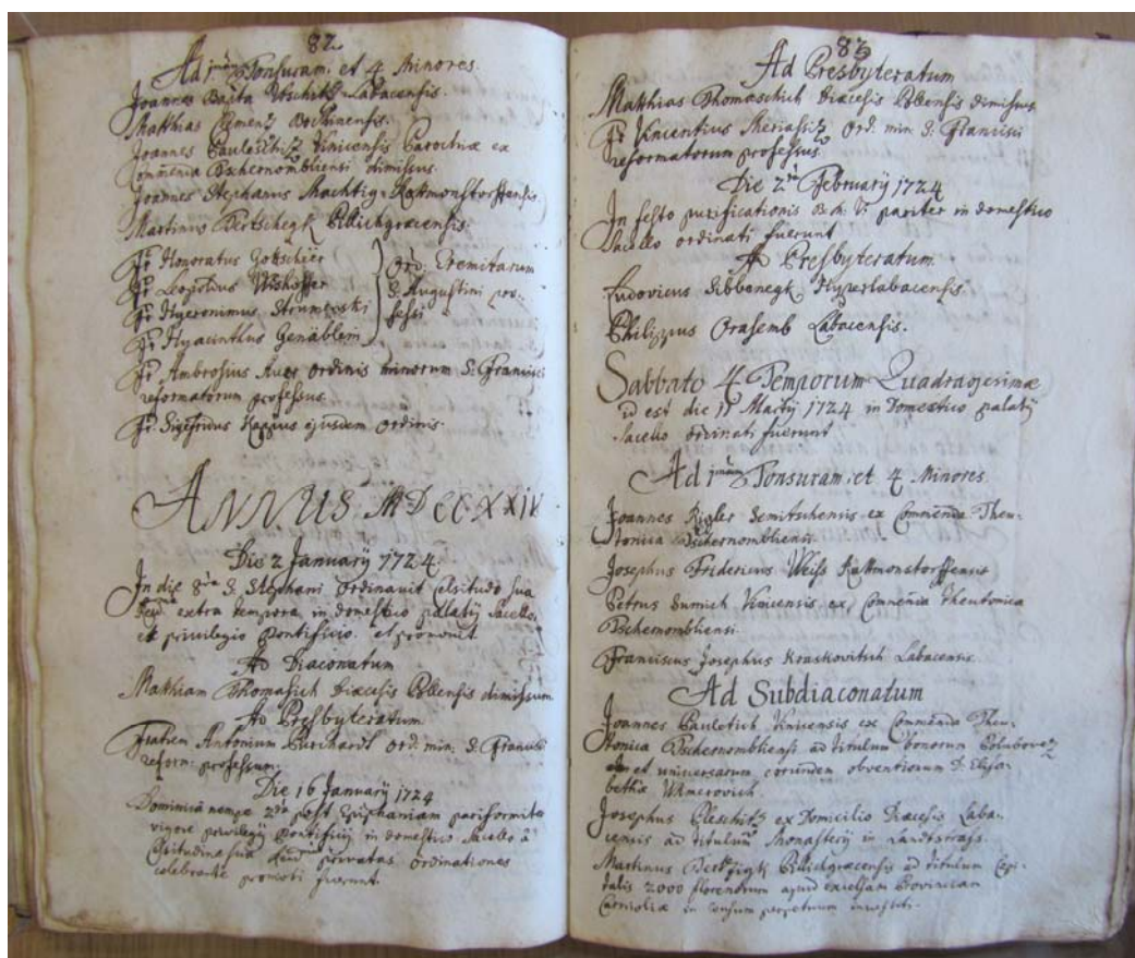
Ordinacijski protokol 1711–1756, str. 82–83 29

Posebej velja opozoriti še na jezik protokola. Ta je latinščina, sami zapisi v protokolu pa se pogosto odmaknejo od slovničnih pravil, zlasti v rabi sklonov.