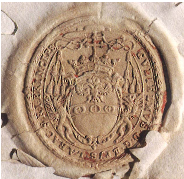
Pečat škofa Leslieja 18

Ogrskem. Papež Klemen XI. je imenovanje potrdil 5. oktobra 1716. Ker pa je leta 1717 ljubljanski škof Kaunitz nenadoma umrl, je cesar 5. januarja 1718 Leslieja imenoval za 16. ljubljanskega škofa. Papeška potrditev je prispela čez štiri mesece, 6. aprila 1718. Slovesna umestitev v ljubljanski stolnici je bila 24. julija 1718.