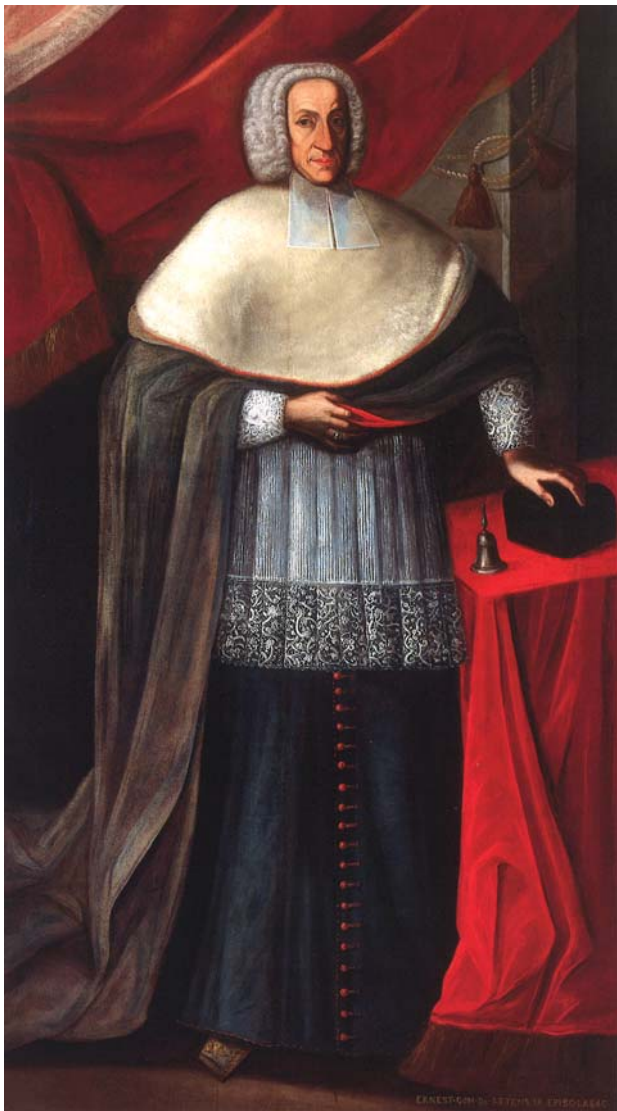
Sigismund Feliks grof Schrattenbach 21

škofije in dalje skliceval sinode v Ljubljani in Gornjem Gradu. Pri svojem delu je bil temeljit, za kar je večkrat dobil javno pohvalo od cesarja. Bil je pobudnik več izdaj katehetskih in liturgičnih knjig.