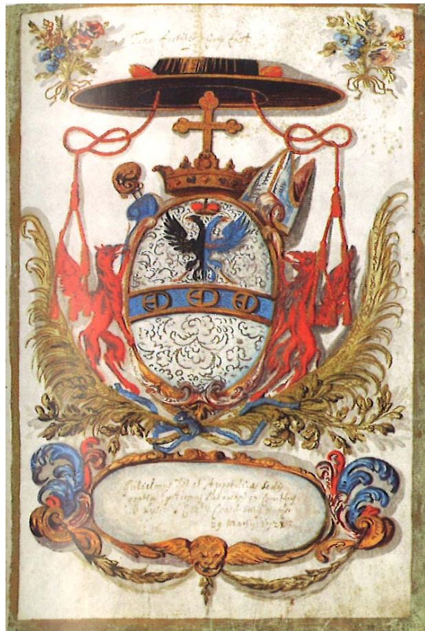
Grb škofa Leslieja 17

znanja za njegovo delo 22. februarja 1710 imenoval za pomožnega škofa v Trstu, papež Klemen XI. pa je imenovanje potrdil 18. februarja 1711. Njegovo škofovsko geslo se je glasilo: Summae eruditionis et sapientiae . 16