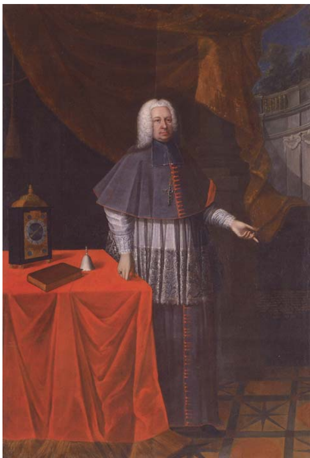
Ernest Amadej Tomaž grof Attems 24

naslovnega trahonenskega in passauskega pomožnega škofa. 6. oktobra 1742 ga je Marija Terezija imenovala za 18. ljubljanskega škofa. Papež Benedikt XIV. (1740–1758) je njegovo imenovanje potrdil 17. decembra 1742. Dovolil mu je obdržati kanonikat tako v Passauu kot tudi v Salzburgu. V ljubljanski stolnici je bil slovesno umeščen 27. marca 1743. 23