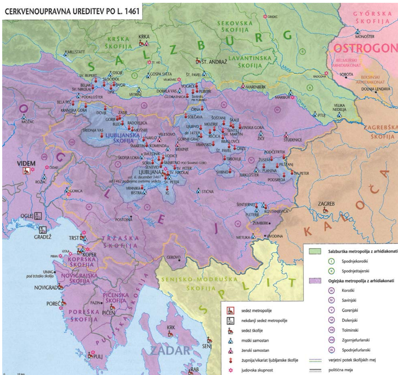
Cerkvenoupravna ureditev po letu 1461 2

Ljubljansko škofijo je ustanovil cesar Friderik III. (1452–1493) 6. decembra 1461, papež Pij II. (1458–1464) pa je cesarjevo odločitev potrdil 6. septembra 1462. Njeni ustanovitvi je botrovala vrsta dejavnikov v cesarstvu, posebej še po letu 1420, ko so Benečani zasedli večji del Furlanije in razkrojili politično oblast oglejskih patriarhov. S tem so Habsburžani za vedno izgubili vpliv na imenovanje oglejskega patriarha, zasedba Furla-