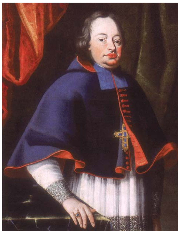
Franc Karel grof Kaunitz–Rietberg 14

trdil 1. junija 1711. Papež je Kaunitzu ob imenovanju dovolil obdržati vse kanonikate. Škofovsko posvečenje je Kaunitz prejel v Rimu iz rok kardinala Fabrizia Paulitia (1697–1726). 12 Njegovo škofovsko geslo je bilo: Nil charius pietatae . 13 Novi ljubljanski knezoškof je v Ljubljano prispel 29. avgusta 1711, v ljubljanski stolnici pa je bil slovesno umeščen 10. septembra 1711.