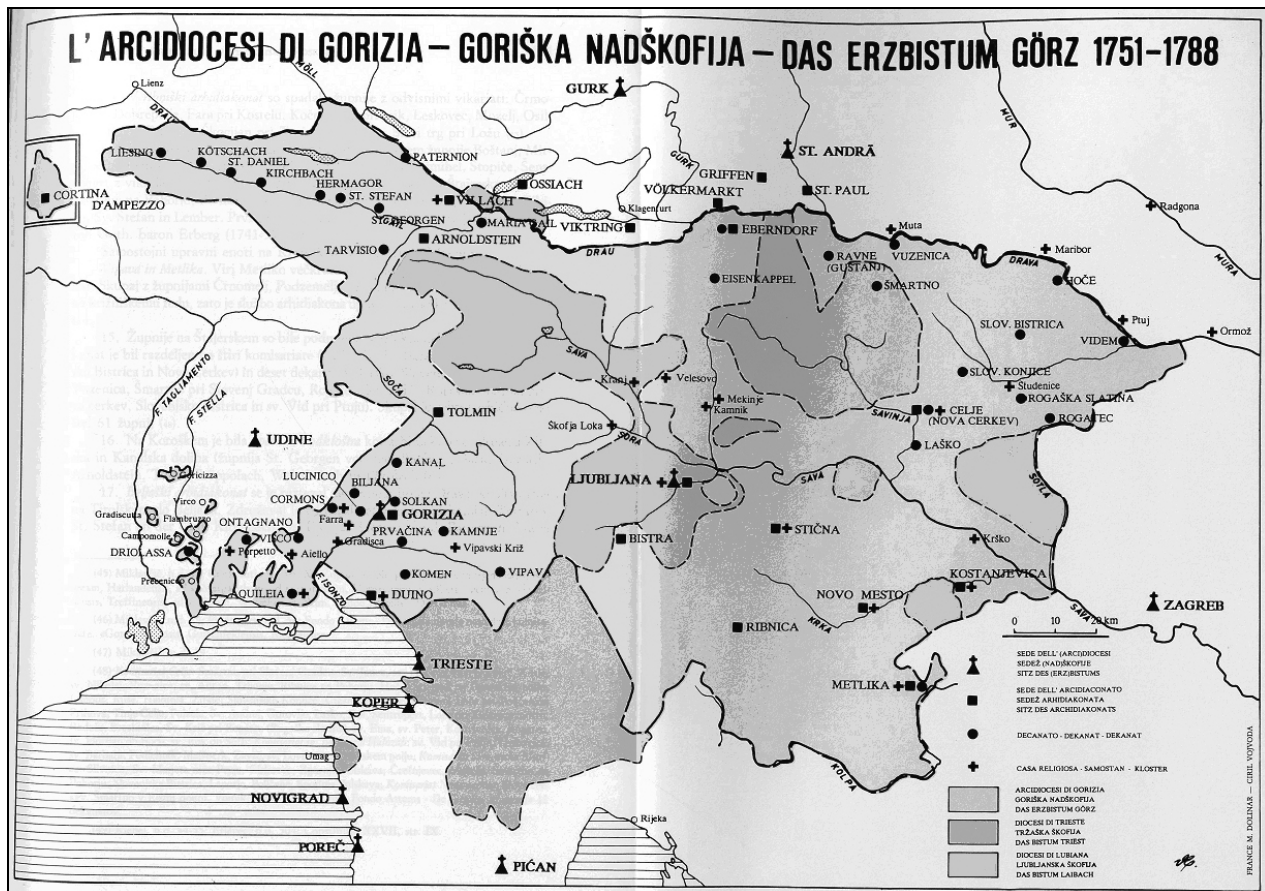
Zemljevid goriške nadškofije 6